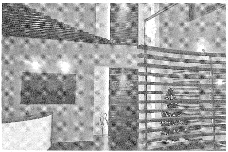
▲2014年10月オープンした「らくら宮の森」のエントランス。優しい暖炉の火が迎え入れてくれる

定、隣接地に認知症グループホーム「公衆苑ほほえみ」、札幌市北区で介護付有料老人ホーム「花ごよみ」(定員30人)を順次整備した。定員125人の公衆苑は特定施設基準を上回る常勤換算2.5対1の手厚いケアを提案、常に安定した稼働率で、隣接クリニック