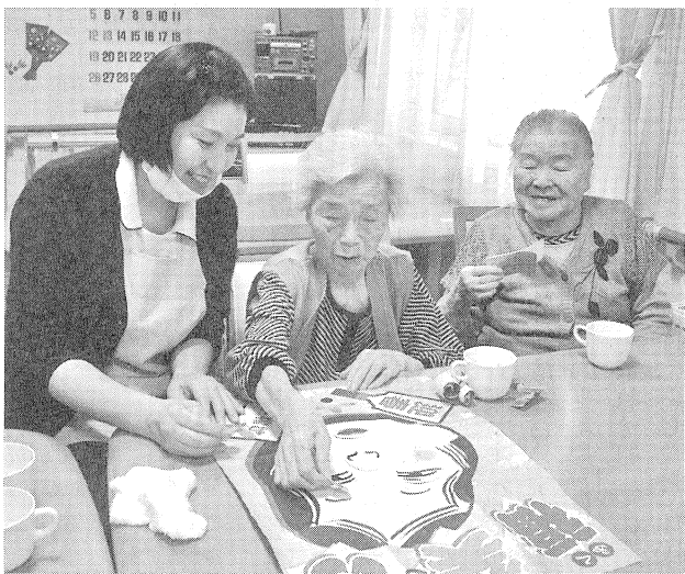
▲当別町と札幌市内で有料老人ホーム、認知症グループホーム、通所介護など運営する「らくらグループ」。各拠点で利用者と職員のいきいきとした表情が見られる